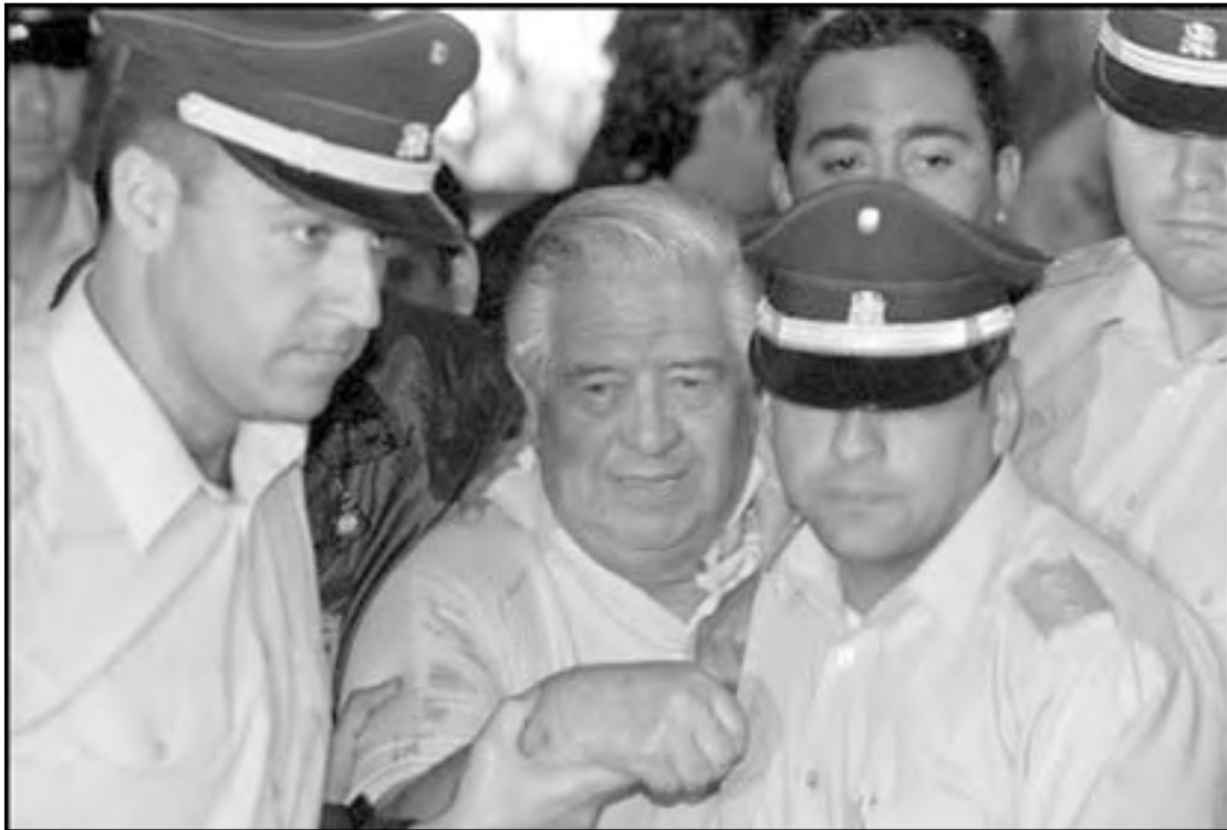
(ARCHIVO) Funcionarios policiales custodian al ex jefe de Inteligencia de Pinochet, el general retirado Manuel Contreras al arribar a la Corte el 28 de enero de 2005. Contreras solicitó un careo con Pinochet el 17 de noviembre de 2005 ya que niega que Pinochet desconociera las operaciones que se llevaban adelante y que incluían la violación de los derechos humanos.

SANTIAGO DE CHILE (AP) - El abogado del ex jefe de la policía secreta del régimen militar general Manuel Contreras solicitó el jueves carear a su cliente con Augusto